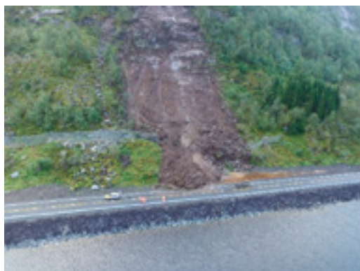
Bildet viser eit fanggjerdar som vart øydelagt av eit stort skred på E 39 ved Drægebøvatn i 2016.