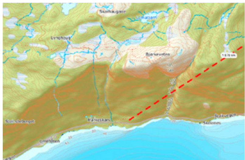
Figur 1: Eksempel på prosjektark (Fv. 79 Steinstøberget)