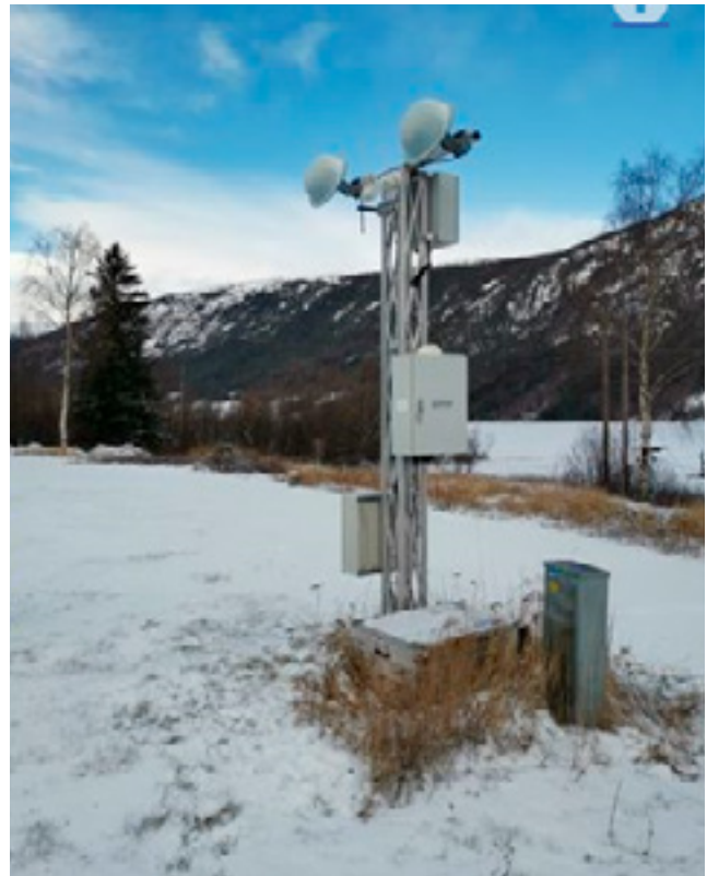
Radar som detekterer snøskred koplust opp mot bommar langs vegen. Drifting av slike system krev tett oppfølging og årlege ressursar.

I slike anlegg (geofon/radar) fylgjer ein med på bevegelsar i terrenget slik at ein kan stenge vegen før skred når vegen. Eit eksempel kan vere varslingsystem med bommar som går ned før snø- eller flaumskred kjem i vegbana. Dette kan vurderast der anna sikring ikkje let seg gjennomføre, til dømes i område der bratt sideterreng ikkje tillèt terrengtiltak (vollar) eller der fanggjerde ikkje gjev tilstrekkeleg sikringseffekt. Slike anlegg krev kontinuerleg oppfølging og må ha årlege løyvingar for drift og vedlikehald.