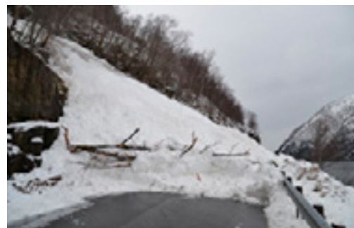
Fv 500 Kovagjelet, Sunndal, Kvinnherad, januar 2015

Snø- og sørpeskred førekjem i bratte i ravinar (gjel) og i dalsider. Vêrforholda gjennom vinteren som temperatur, nedbørsmengder og vindretning er avgjerande for kor høg skredfaren blir. Til dømes gir stort snøfall i kombinasjon med vind auka risiko for snøskred. Sørpeskreda går når snøen er så metta av vatn at den nærmast er flytande. Desse skreda går naturleg nok om vinteren og om våren.