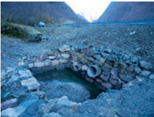
Fv 5623 magasin

Magasin blir brukt for å stoppe mindre snø-, sørpe- og flaumskred. Tiltak vert kombinert med kulvertar eller stikkrenner, og i nokre tilfelle vert det etablert ein fangvoll eller betongmur mellom magasin og vegbane som supplerande skredsikring.