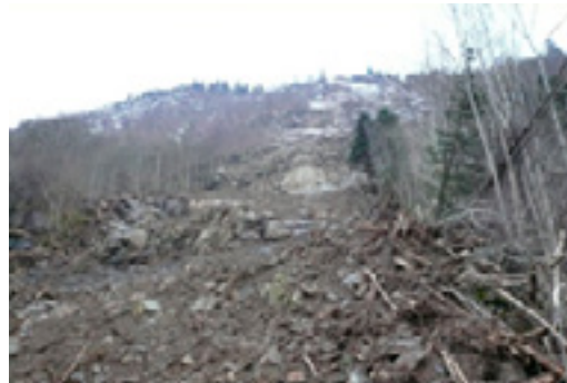
Fv 550 Eikhamrane nord, vestsida av Sørfjorden, 26 desember 2011

Leirskred (kvikkleire) går under marin grense. Det vil seie grensa som avspeglar øvre havnivå i istidas slutfase. Marin grense er på det meste rundt 130 moh i indre strøk av fylket, mens den ved kysten er nokre titals meter. Leirskred er sjeldne i fylket, men det er fleire lokalt ustabile område der det har vore slike skred.