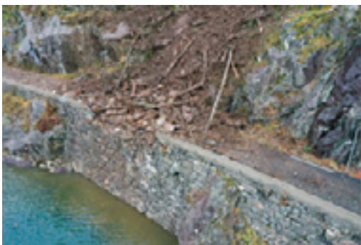
Fv 5374. Steinsprang som har drege med seg jordmassar og tre i Osa i november 2020.

Blokker og stein med eit volum under 100 m 3 som losnar i eit bratt sideterreng er definert som steinsprang. Skredhendingar med volum mellom 100–100 000 m 3 kallast steinskred. Dei aller største, og svært sjeldne, kallast fjellskred (>100 000 m 3 ). Bergart, lagdeling og oppsprekking påverkar stabiliteten i fjellet. Frost- og rotsprenging jekkar gradvis ut blokker og stein. Utløysande faktorar er ofte mildver i etterkant av frostperiodar eller i samband med kraftig regnver.