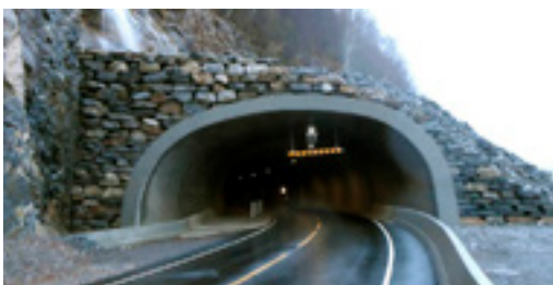
Fv 572. Portal ved Torgilsberg tunellen

Tunnelmunningar er ofte skredutsette og det vert derfor bygd betongkonstruksjonar tett opp mot berget. Desse kan dimensjonast for å tåle store belastningar. I Vestland fylke er svært mange tunnelar og dermed tunnelportalar. Portalane av eldre årgang er ofte altfor korte og for svake. Portalar etter dagens standard er derimot oftast robuste og effektive. Mange stader er det svært krevjande å bygge portal sidan dette ofte inneber full reinsk og gjerne eit fanggjerdje for å sikre arbeidarane som byggjer portalen.