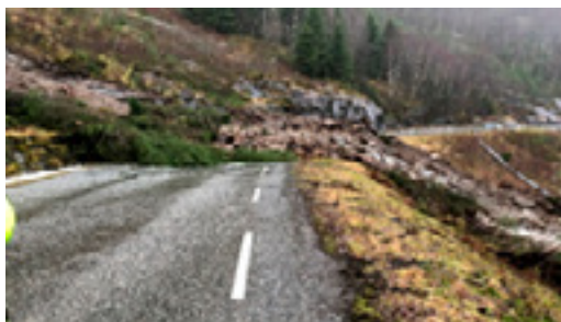
Fv 5406 ved Kallestad bru i februar 2010.

Flaumskred er ein type lausmasseskred som er vanlige i gjel og bekkeløp. Desse skreda består av stein, jord og vatn som går. Desse skreda er vêravhengige og vert utløyst ved intenst regnver og eventuelt ved tilførsel av smeltevatn. I nokre tilfelle kan slike skred komme som følge av tidlegare skred som har demt opp bekkar eller elvar i terrenget, og der demningen til slutt brest. Flaumskred kan gå gjennom heile året.