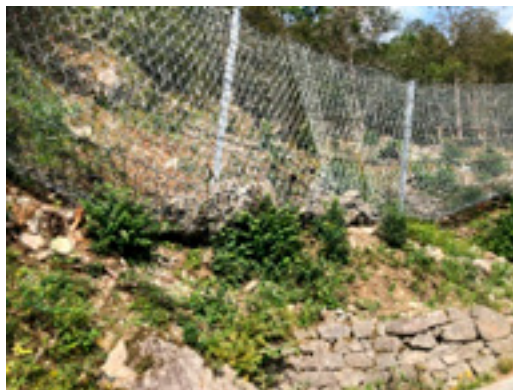
Fv 79. Bildet viser eit fanggjerdar som stoppa eit steinsprang i Granvin i 2019.

Ved nybygging av veg bør ein derimot, så langt det er råd, unngå fanggjerdar til anna bruk enn som arbeidssikring. Fanggjerdar skal ikkje erstatte portalar ved nybygging av veg, men kan eventuelt brukast i ein overgang mot terrenget utanfor portalen.