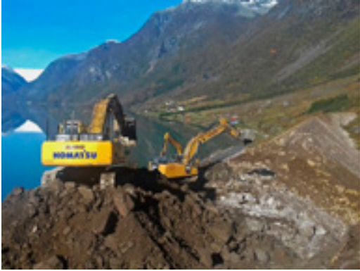
Fv 5641. Bygging av skredvoll ved Veitstrandsvegen.