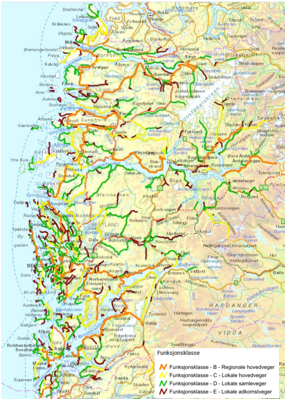
Figur 3-1: Oversiktskartet viser funksjonsinndeling av fylkesvegnettet i Vestland.